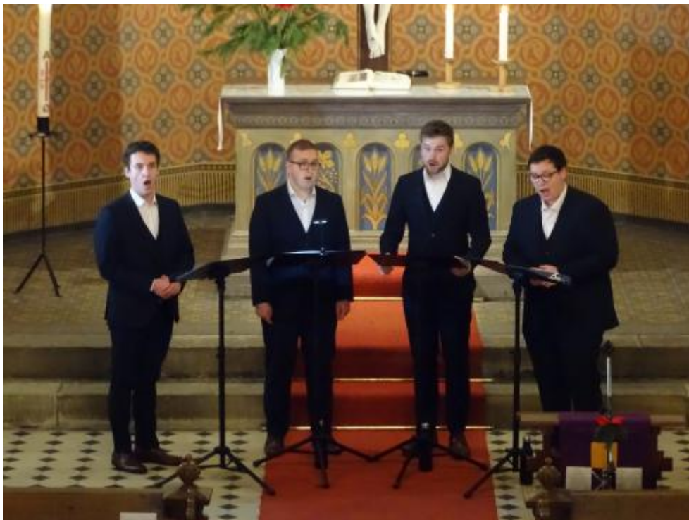
In Leopoldshall sangen im Advent "Mehr als vier" ...

... und in Hecklingen waren zu Heiligabend - nein, genauer gesagt: für Heiligabend - Engel auf dem Rathausplatz.